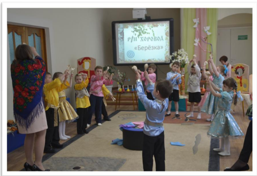
... У березки дети расплясались, На березку все залюбовались...