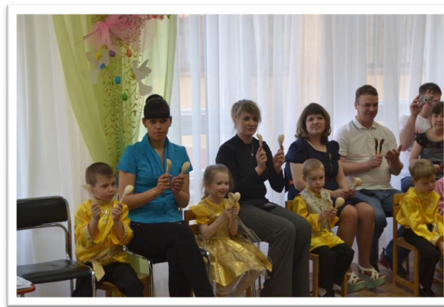
В исполнении оркестра «Летели две птички...»