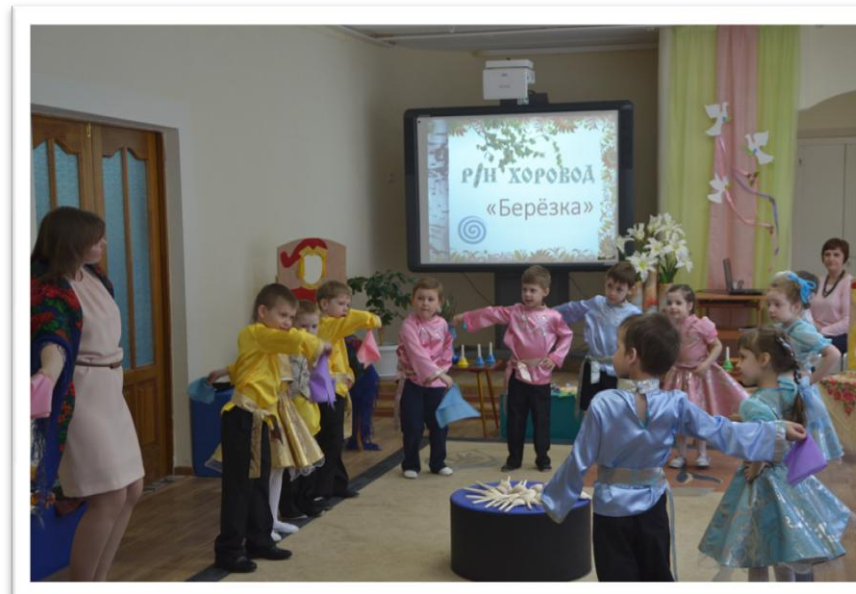
Русский народный хоровод «Берёзка»