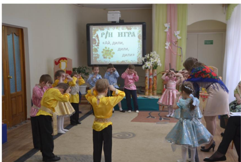
Ай, дили-дили-дили, да мы кого-то видели: Глазастого, ушастого, вихрастого, зубастого...