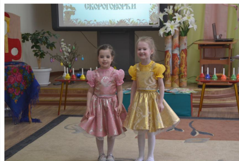
Музыкальная скороговорка «Веники, веники...»