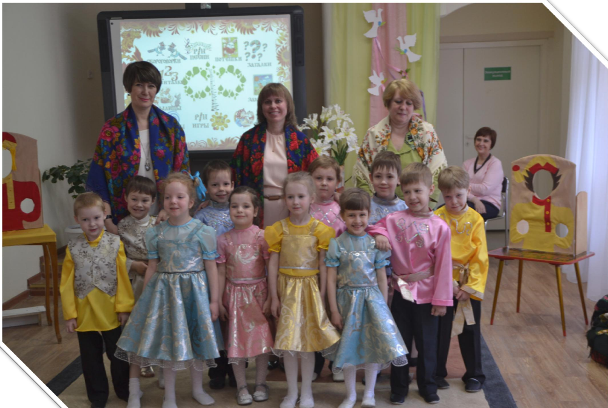
Воспитанники старшей группы “Рябинка”