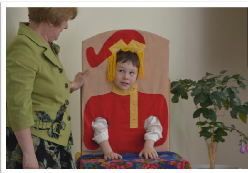
Тантамареска «Эй, зайчишка, не дрожи...»