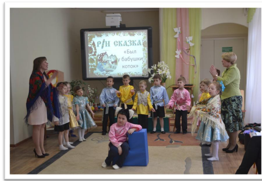
Русская народная сказка «Был у бабушки коток...»