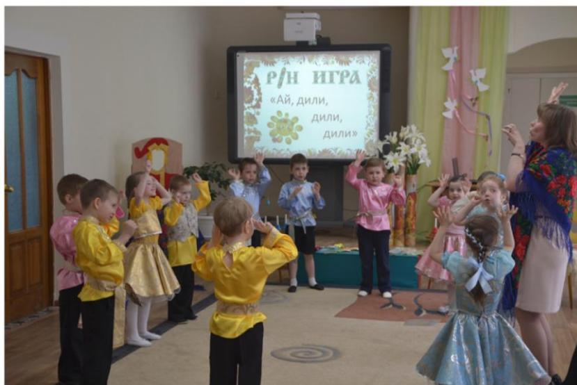
Русская народная игра "Ай, дили, дили, дили"