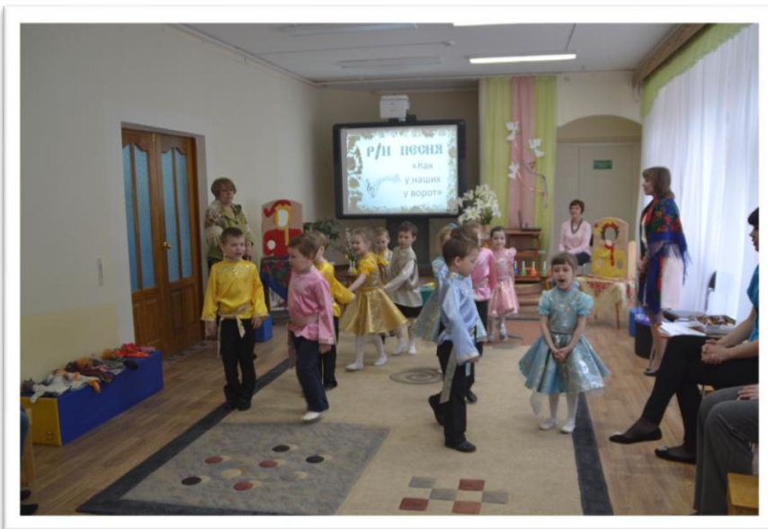
Русская народная песня «Как у наших у ворот»