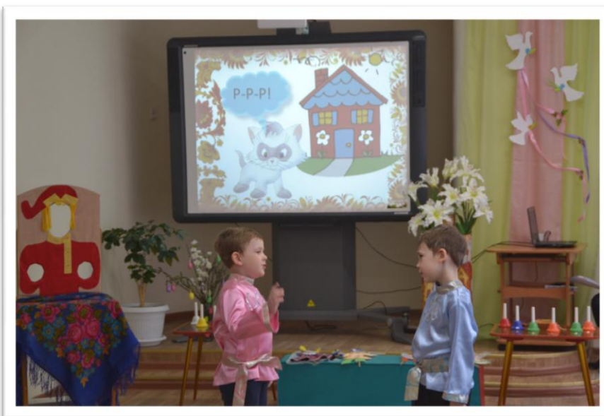
Небылица «Злая кошка громко лает...»