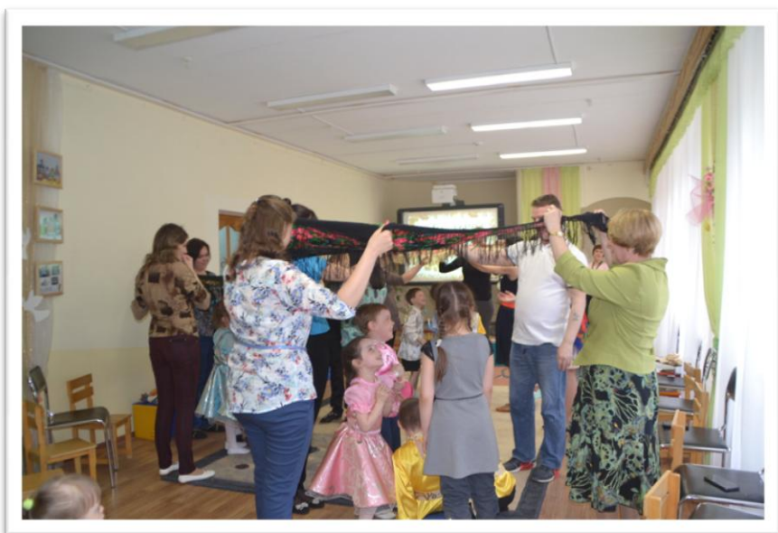
Уральская народная игра «Шатер»